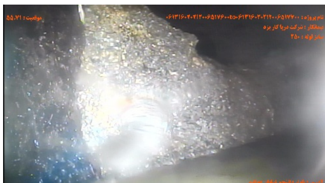
شماره تصویر ۵ عنوان نقطه ی پایان / آدمرو موقعیت ۵۵۰۷۱ کد MHF