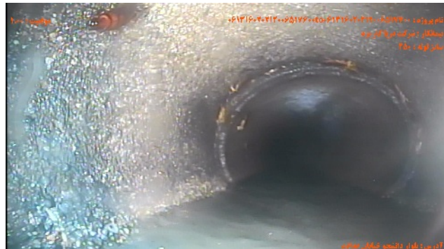
شماره تصویر ۲ عنوان تراز آب / تراز آب کدر موقعیت ۱۰۰۰ کد WLT درصد ۵