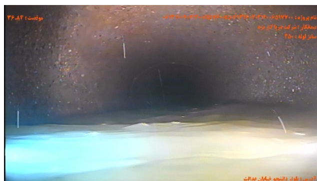
شماره تصویر ۴ عنوان تراز آب / تراز آب کدر موقعیت ۳۶۰۸۴ کد WLT درصد ۱۰