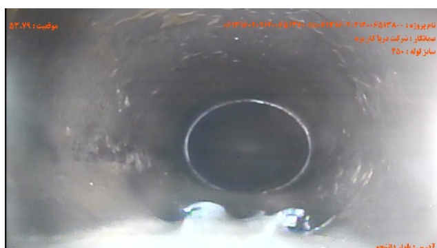
شماره تصویر: ۳ عنوان: نقطه ی پایان / آدمرو موقیعت: ۵۳.۷۹ کد MHF