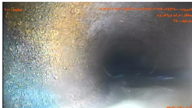
شماره تصویر: ۲ عنوان: تراز آب / تراز آب کدر موقیعت: ۱۰۰۰ کد WLT ۵ درصد