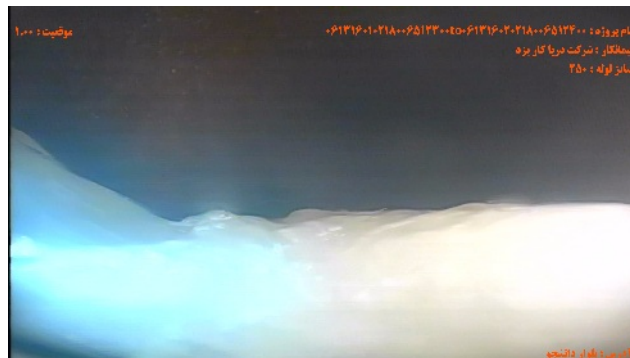
شماره تصویر ۲ عنوان تراز آب / تراز آب کدر موقیبت ۱۰۰ کد WLT درصد ۵