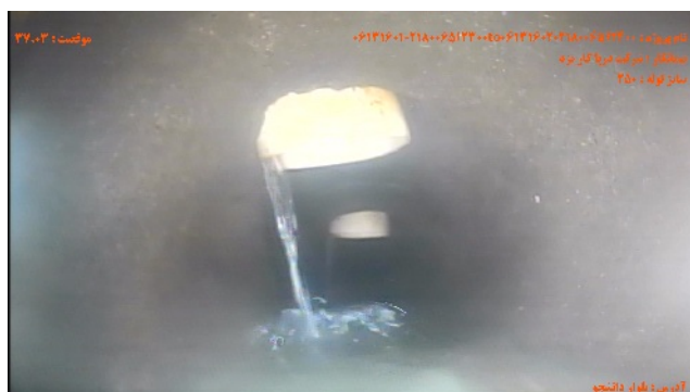
شماره تصویر ۳ عنوان اتصال جانبی معيوب / اتصال معيوب اشعاب موقیبت ۳۷.۰۳ کد CX