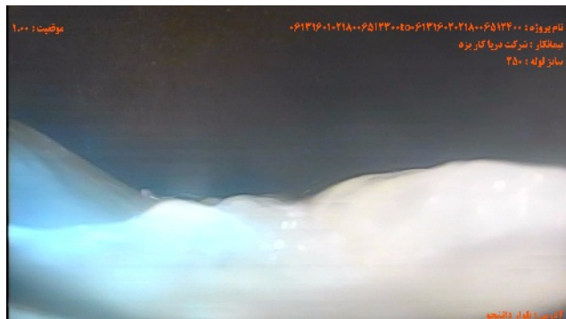
شماره تصویر ۱ عنوان نقطه ی شروع / آدمرو موقیبت ۱۰۰ کد MH