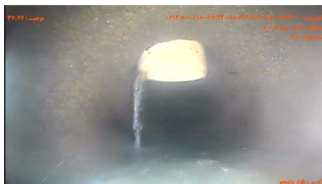
شماره تصویر ۴ عنوان اتصال جانبی معيوب / اتصال معيوب اشعاب موقیبت ۳۷.۷۷ کد CX